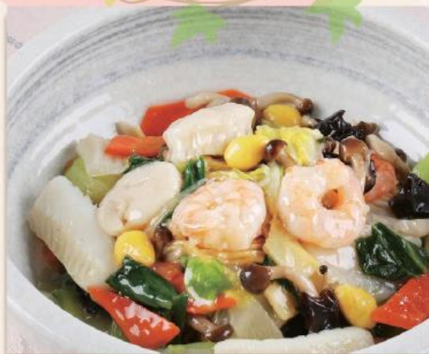
海の幸あんかけ焼きそば (塩味)