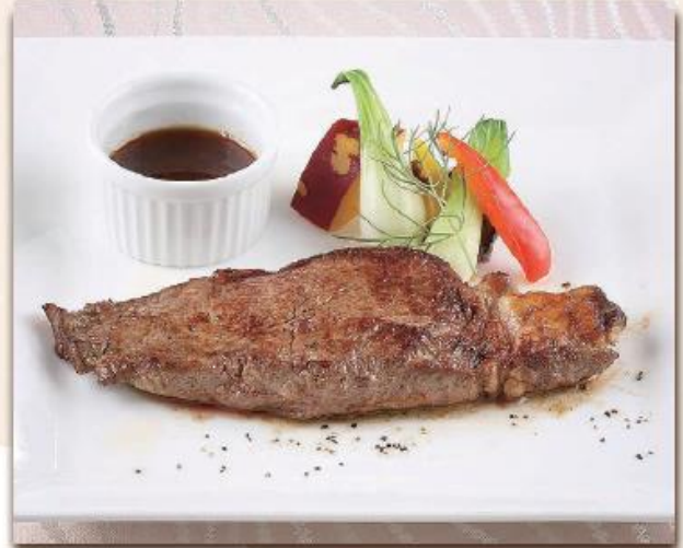
サーロインのポワレ (インJECTIONビーフ) ¥1,500 (税込¥1,620)