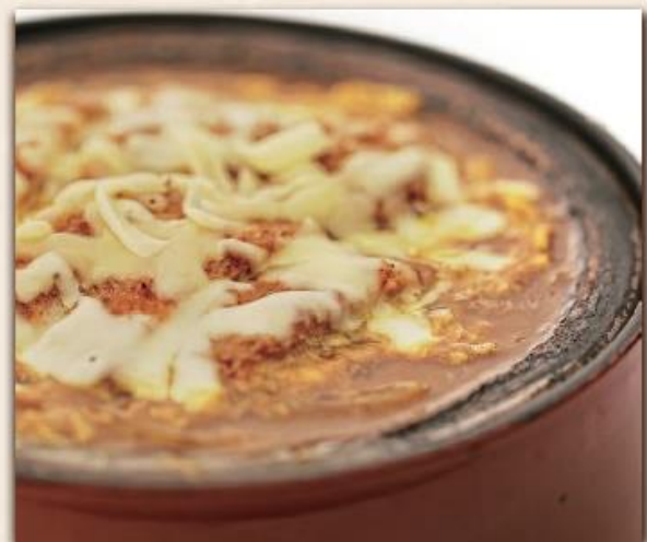
かつ鍋カレー風味