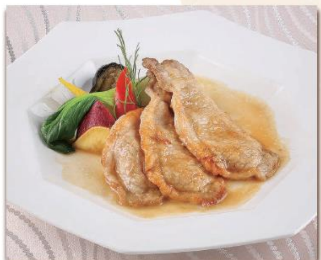
ローズポークのしょうが焼き ¥1,200 (税込¥1,296)