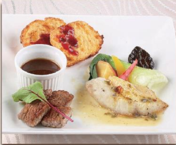
ワンプレートランチ 写真はイメージです ¥1,300 (税込¥1,404)