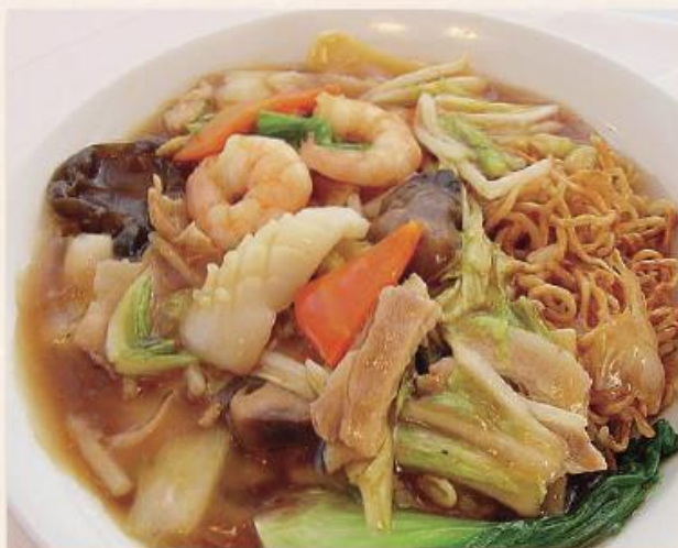
五目あんかけ焼きそば