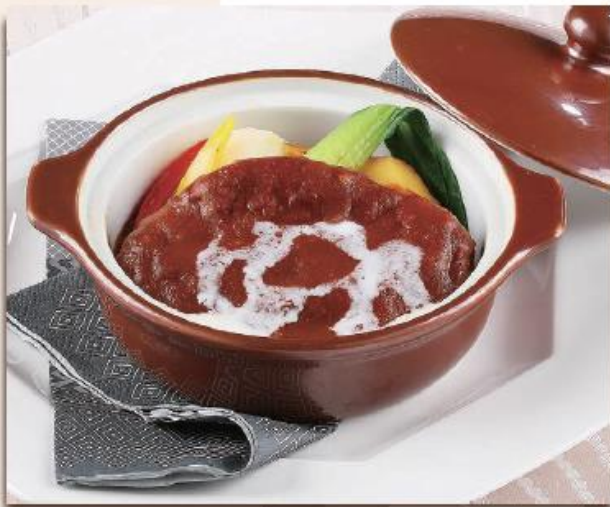
煮込みハンバーグ ¥1,300 (税込¥1,404)